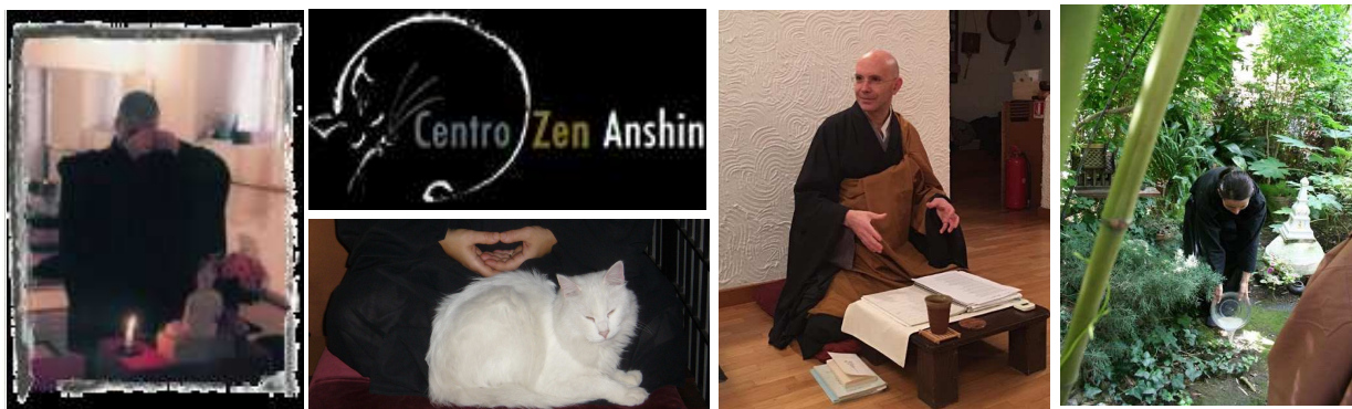
Le foto sono state gentilmente concesse dai Centri Zen